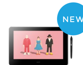
Wacom Cintiq Pro 16