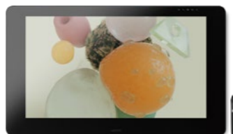
Wacom Cintiq Pro 32