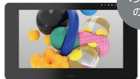
Wacom Cintiq Pro 24 ペンモデル