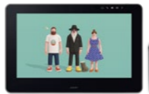
Wacom Cintiq Pro 16